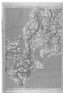
〔中部地方の一部と近畿地方の地図〕