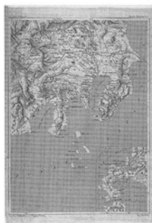
〔関東地方と北海道の一部の地図〕