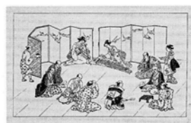
〔琴と胡弓を弾く女, お茶を前に 話をする男たち〕