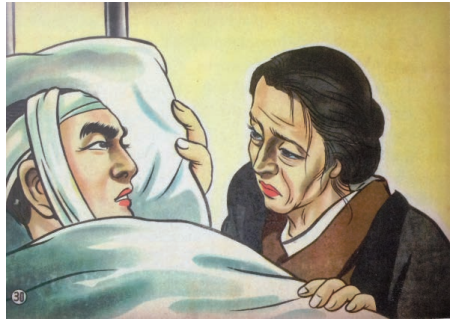
図2 息子との死別。『母の顔』より (p. 200)