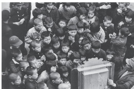
図1 街角紙芝居の風景 (p. 41)

一九三〇年代に誕生した紙芝居は、古く絵巻、江戸時代の写し絵、立絵などの視覚媒体から図を主体とした物語を語る形を受け継いだ。絵、文字、演出の三つの要素で成り立つ紙芝居は数年の間に広く普及し、とくに庶民層を中心に根強い人気を誇った。やがて『黄金バット』などの有名作の