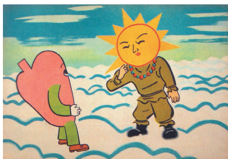
図3 健ちゃんの心臓が神に助けを求める (p. 155『健ちゃんバンザイ』より)

芝居のいわゆる「宣伝効果」も、このような特殊な時空背景に置かれたからこそ発揮できたかもしれない。念をおすと、プロパガンダを「文化的」に見るスタンスは、決して戦争の歴史を無責任に相対化し、あるいは日本文化と軍国主義を本質主義的に結びつけようとするものではない。むしろ「国策紙芝居」を「政治的」という固定概念から開放させたほうが、より鳥瞰的、多元的な視角でその全貌を見定められるのではないかと考える。著者も指摘しているように、国策紙芝居の演出内容、方式が厳しく規定されていたにもかかわらず、一部の紙芝居の内