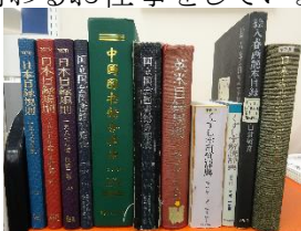
目録規則やくずし字辞典等