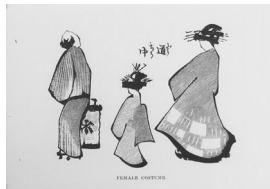
Female costume 女の服装[花魁道中]