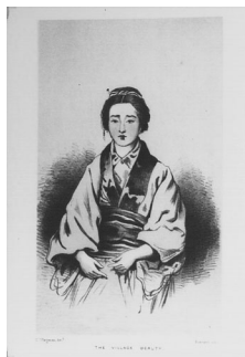
The village beauty 村の美人