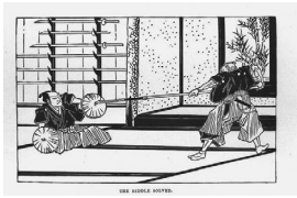
The riddle solved. 謎が解かれた