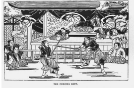
The fencing bout. 剣術の試合