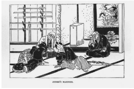
Jiubei's madness. 十兵衛の狂気