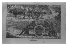
Chars japonais. 日本の荷車