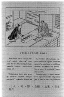
L'oncle et son neveu. おじと甥