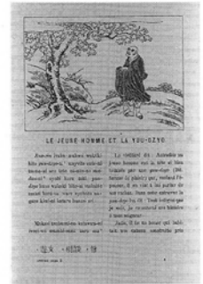
Le jeune homme et la yu-dzyo. 若者と遊女