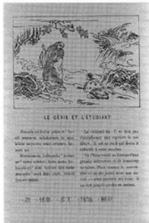
Le genie et l'etudiant. 仙人と弟子