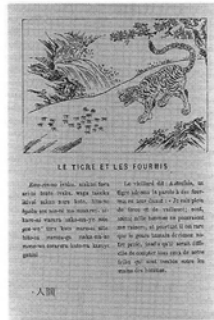
Le tigre et les fourmis. 虎とアリ