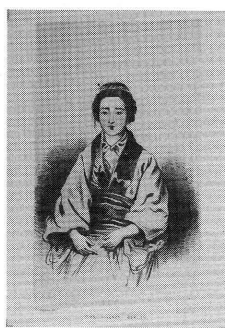
The village beauty 村の美人