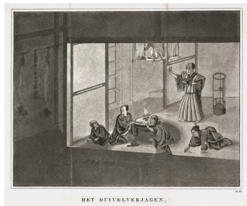
「鬼退治」(メイラン『日本』81頁)