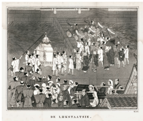
「葬儀」(メイラン『日本』173頁)