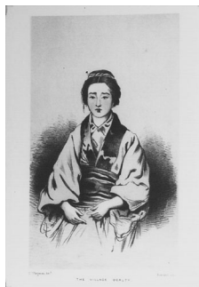
The village beauty 村の美人