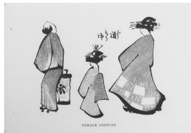
Female costume 女の服装[花魁道中]