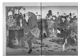
[紙屑買いの男に向かって子どもたちが石を投げている]