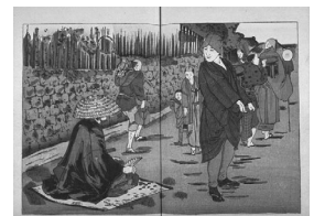
[変わった服装の乞食に金を与えている]