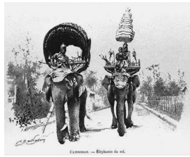
Cambodge. - Éléphants du roi. カンボジア—国王の象

トンキン[東京]—ハノイの小さい湖[ホアンキエム[還剣]湖]上のアルマン氏のシヤムの丸木船