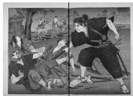
[駕籠鼻たちに襲われた夫婦を助ける]