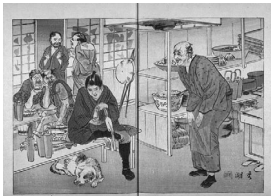
[酒を飲んで代金を払っている若者を駕籠鼻たちが見ている]