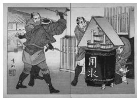
[用水桶の陰に隠れた盗賊を捕らえる]