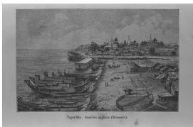
Tayet-Mio, frontière anglaise (Birmanie). タエット・ミオ, 英国の国境 (ビルマ)