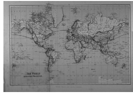
The World on Mercator's projection. メルカトル式投影図法で表された 世界[世界地図]