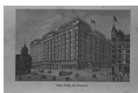
Palace Hôtel (San Francisco). パレスホテル(サンフランシスコ)