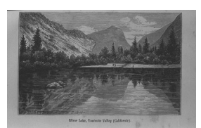
Mirror[Mirror] Lake, Yosemite Valley (Californie). ミラー湖, ヨセミテ渓谷 (カリフォルニア)