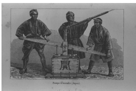
Pompe à incendie (Japon). 消火ポンプ(日本)