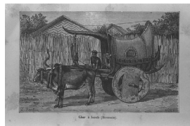
Char à boeufs (Birmanie). 牛車(ビルマ)