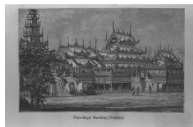
Palais-Royal Mandaley (Birmanie). マンダレー王宮(ビルマ)