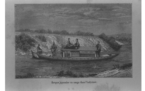
Barque japonaise en usage dans l'intérieur. 国内で使われている日本の小舟