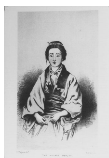
The village beauty 村の美人