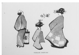
Female costume 女の服装[花魁道中]