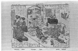
Komatsu. Ofana. Fukazen. Tofei. Sakitsi. Tsikusai. 小松, お花, 深善, 戸平, 左吉, 竹斎