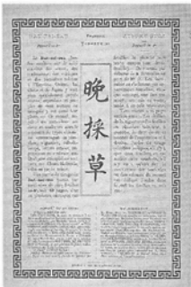
[Back cover] [裏表紙]