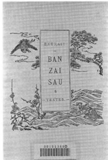
[Added title page] [副標題紙]