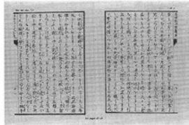
Voir pages 83 - 93. p. 83-93を見よ[日本語原本の ページ]