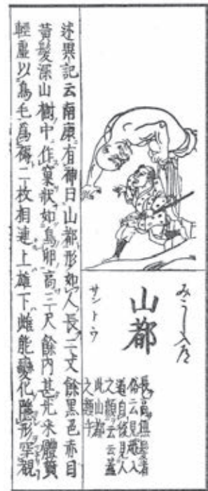
図2 『和漢三才図会』「山都」 （『和漢三才図会』上、東京美術、1970年から引用）

以上 i～v のとおり、現在では妖怪として理解される固有名詞のほとんどが、16世紀までは生類に分類されていた。それが17世紀になると、人倫門や神祇門など別の部門へ分類されるものも散見されるが、生類との境界線は曖昧なままであった。境界の曖昧さについては、日本と中国との文化的境界に