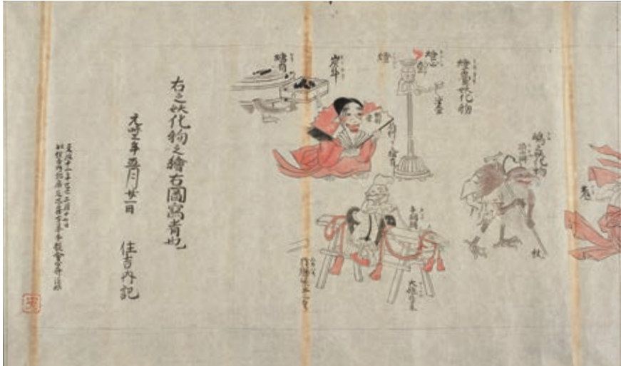
図3 「百鬼夜行図」(模本) 東京国立博物館蔵、Image: TNM Image Archives

は「妖化物之絵」と表現されている点である。それは「百鬼夜行絵巻」が、本来「妖化物(之)絵」ないし「妖物(之)絵」と呼ばれていた可能性を示唆している。