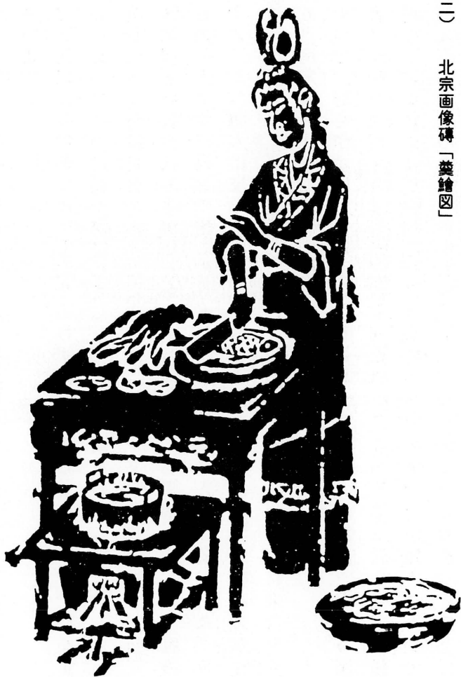
資料(二) 北宗画像磚「羹繪図」

包丁があります。エプロンをかけている美しい料理人が袖をたくしあげて、ていねいに繪をつくっています。そして調理台のそばの炉で汁が煮立っています。