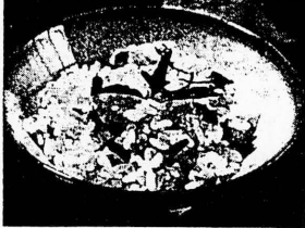
クコは滋養成分が豊富で、特に糖質とタンパク質のバランスが良い。また、クコには、抗酸化作用や、免疫機能を高める効果も期待されている。」