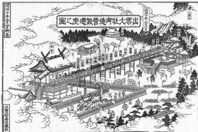
図4 遷宮直前の出雲大社を描いた「出雲大社御造宮仮遷座之図(明治十年)」(多田他著「神社仏閣地図」)

られ、政府が定めた国家儀礼を執行することになる。明治十四年に式年遷宮はあったが、杵築町の景観全体が変貌するのはこのときではなく、ずっと後の明治末年である。大社鉄道の敷設が決定的だった。