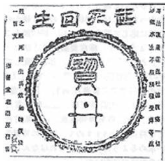
图7 乐善堂刊登在《申报》1892年8月13日的药品广告（宝丹）

乐善堂印制的书籍在中国大受欢迎，原因很多，其印刷技术的精美是主要原因。宋原放指出：“它首创铜板缩印小字本我国古籍，精美绝伦，其中以《吟香阁丛书》和《康熙字典》最为精致，超过《申报》馆铅印的《申报馆丛书》，使人耳目一新，震动了当时的书刊业，受到知识界的赞赏。” 26 此外，其在《申报》刊登的大量广告也不