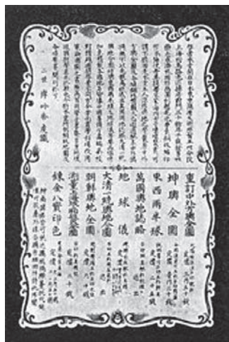
图8 乐善堂印制面向中国读者的书籍广告