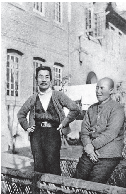
图1 1933年初鲁迅在上海内山完造寓所前与内山完造合影

人是文化的符号，“文化即人化”。日本人在上海无论从事商业、文化活动，还是衣食住行日常生活，都对上海这个城市乃至江南文化产生了“多元效应”以及潜移默化的影响。最引人瞩目的当属建筑。由于当时“西风东渐”，上海的新兴建筑都有着浓郁的西洋风格，而日本人在虹口一带设立神社、寺庙，并在沿街马路建造民宅，耸立起一些与西洋欧美建筑不同的“东洋”日式建筑，如虹口北四川路千爱里一带花园里弄住宅。其中，位于千爱里3号的内山完造寓所（图一）是幢坐北朝南的新式里弄花园洋房，砖木结构假三层，拉毛水泥墙面颇具日本式建筑风格，整幢建筑显得小巧精致。多伦路85号日式小洋房，建于20世纪30年代初，它的建筑形态处理简洁，属于日本“洋风时期”的住宅建筑类型，并有东西方建筑风格融合的特征。这一洋房为复式人字形屋顶，铺盖小青瓦，中国传统的歇山式山墙、平拱木门窗，外墙立面采用现代式装修手法，贴面为拉毛水泥。北立面门廊采用罗马风格建筑，即古罗马式的拱和柱。走入室内，可见向外的门窗大多是推拉式的，木棍方格糊纸，内部隔断