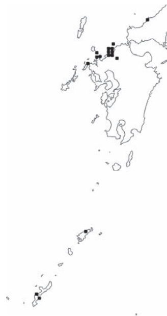
図4 浙江石材碇石分布図 CraftMAPの白地図より作成

また、斯波 1968は、「両浙では、江南デルタおよび浙江流域諸州の造船はたしかに技術