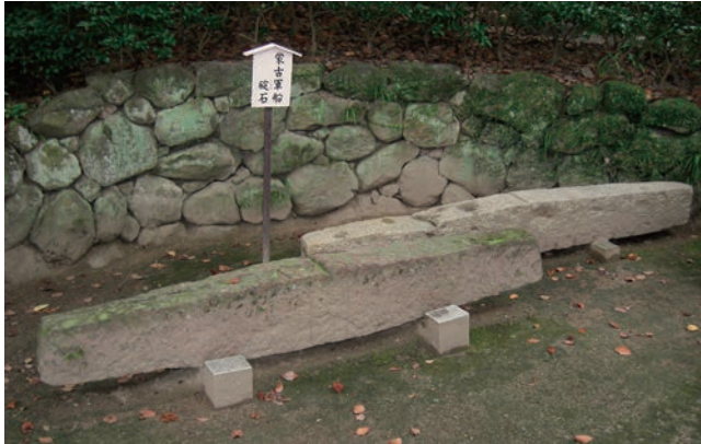
図5 宮崎宮碇石（前、凝灰質砂岩） 春日自衛隊碇石（後、花崗岩）