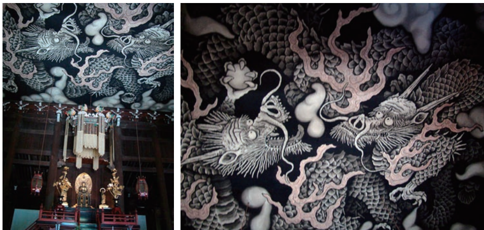
京都建仁寺法堂内双龙图双龙图局部 2011年4月17日拍摄

第二，因为京都寺院与中国有此渊源联系，京都寺院中的屏风画或壁画也大多受到中国画风的影响，或是其素材源于中国。其中最典型的莫过于天龙寺、建仁寺的云龙图和大龙双图。天龙寺的云龙图为日本著名画家加山又造于1997年应约而作；建仁寺的大龙双图为日本画家小泉淳作之作，完成于2002年4月。两者惊人的相似之处，除了大胆地将龙的四爪画为五爪，突破了关于龙爪本身的政治图腾和禁忌外，其素材都源于中国关于云龙的传说。当然，这些现代作品本身不能说明古代中国和京都的关联。但有一点可以肯定，无论是天龙寺，还