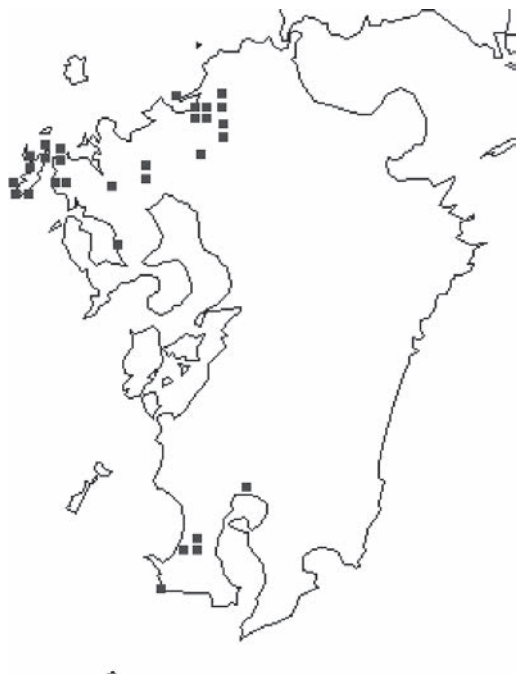
図1 薩摩塔類分布図 CraftMAPの白地図より作成

および、岩石薄片に基づくエネルギー分散型X線マイクロアナライザーによる主成分化学組成分析の4種である 8 。以上の分析から、坊津薩摩塔石材、大村薩摩塔石材、寧波梅園石が、ともに赤味を帯びた明灰色で、粒子の細かい堆積性の塊状凝灰岩であること、構成物質の粒径の違いや岩層の側方および垂直方向への変化が見込まれ、元素の分布パターンからその類似性を論ずることは難しいが、三者の含有する元素は共通していること、さらに、三者は長石のほとんどがCaを含まない曹長石からアノーソクレスの限られた組成を持つことが判明し、三者が同一岩体から採集されたことを支持するものとなっている。