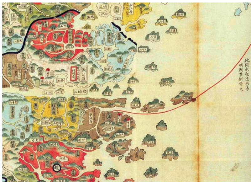
図2 清国十六省之図（部分図）

この地図のなかの地名について、例えば「浙江道」については該当する時代はないので除外するとしても、「南京」という地名とか、あるいは「北京」の赤い枠の上に「順天府」とあるのは、ともに明代以降のことで、地図全体としては宋や元の時代の地名は反映していない。また、寧波府の横には「甬東・明州・慶元」と古い地名の変遷が書き込まれてあり、寧波の地名の変遷を表現している。言い換えれば、別のところにわざわざ「明州津」と書き込む必要はないのである。このように、「清国十六省之図」は明代の地理的な状況を基本とする中国製の地図に、日本側は、わざわざ赤い線を入れ、「明州津」と書き込んだのである。本報告の出発点はここにある。なぜ、「寧波府」でなく、その古名である「明