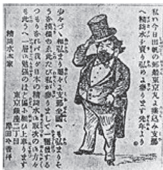
图3：岸田吟香在日本《郵便報知新聞》刊登到中国销售精琦水的插图广告

岸田吟香参与《申报》的“吟坛”活动后，发起成立“玉兰吟社”：“客岁百花生日，适楼之对面玉兰盛开，先生乃狂喜曰：其借此以畅吟怀哉，乃邀集海上诸名流，”“推弢园老民执牛耳，而以社名请于老民。老民曰：嘻，其即命以玉兰吟社乎。斯时与会者共十余人，咸赋诗为先生寿嗣，是月必举