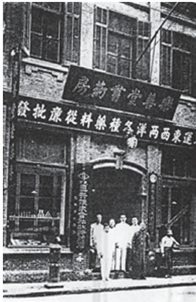
图6 开设在河南路（近福州路）的乐善堂

岸田吟香利用与海上文人的深交，特别是与《申报》主笔何桂笙、黄协埧等人的交情，在《申报》大量刊登乐善堂的药品广告，其数量之多，空前未有，在1880-1893年间，仅药品广告达100种以上。《申报》不仅大量刊登乐善堂的药品广告，主笔还亲自操笔，为其药品宣传书作序。例如，开埠以后的上海，“淫靡之风日益