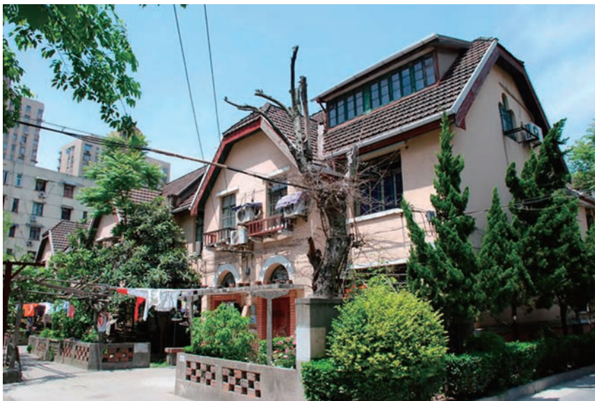
图2 澳门小区日式住宅正面

又如，澳门小区位于澳门路660弄，是民国九年（1920年）日商外棉财团为职员建造的高级住宅。抗日战争胜利后，它被改为中国纺织建设公司第二宿舍，现为居民住宅。房屋为