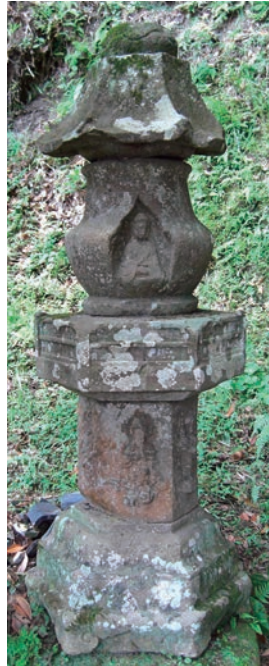
図3 水元神社薩摩塔

西地区石材使用の歴史は長い。梅園石は、主として河湖といった淡水中に沈積して形成された地層を中心とする白亜紀の地層6層中の下から3番目の地層である方岩組地層（寧波盆地西南端の鄞県鳳巖・鄞江橋から奉化外村一帯に露出）に産出する単層で厚みのある褐灰色凝灰岩であり、小溪石は同地層の泥質粉砂岩、砂岩、砂礫岩中から採掘される薄く均質な層理を有する凝灰質砂岩である 10 。