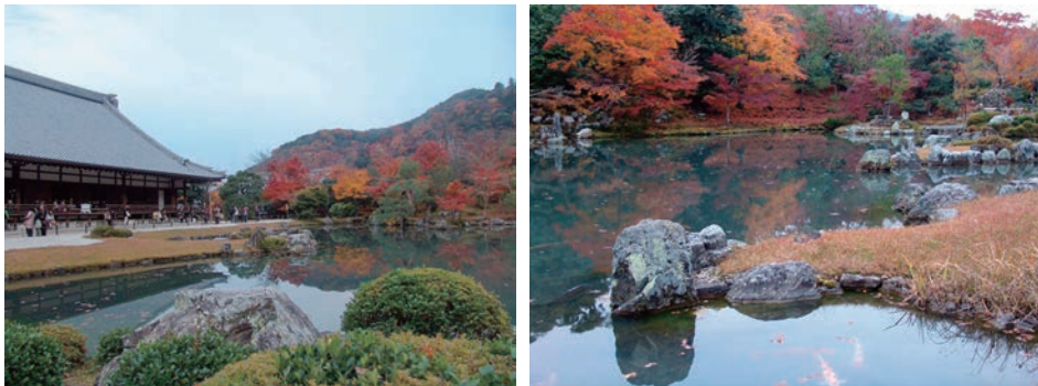
天龙寺内曹源池局部 2010年11月4日拍摄

是建仁寺关于请求现代画家画云龙本身，可能就是一种古代中国和京都间本身关联的延续。此外，我们从天龙寺和建仁寺所收藏的屏风、书画中还可以看到这些关联。