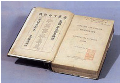
图1 在上海印制的《和英语林集成》（初版）

岸田吟香（1833-1905），日本冈山县人，名太郎，后改名银次。4岁时因暗诵唐诗选，