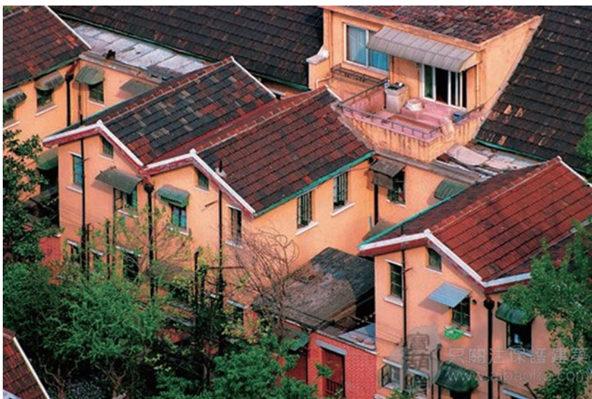
图3 澳门小区日式住宅俯视图