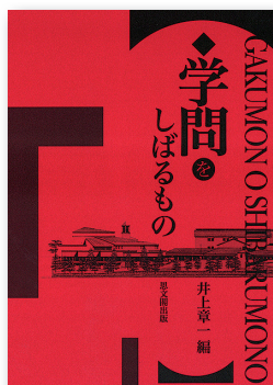
INOUE Shōichi, ed., Gakumon o shibaru mono. Shibunkaku Shuppan, October 2017.

共同研究「怪異・妖怪文化の伝統と創造——研究のさらなる飛躍に向けて」の研究成果報告書であり、怪異・妖怪文化を伝承と創作、図像、分類と方法、メディア、娯楽、国際的視野などの視角から分析を行っている。