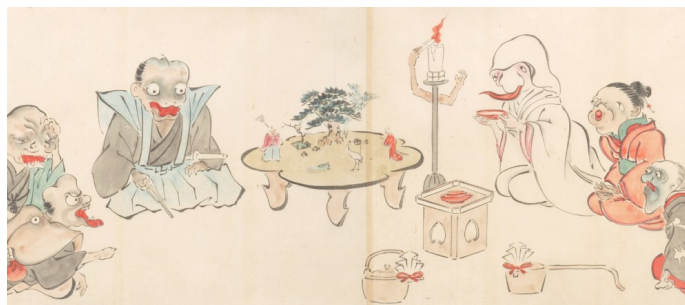
◆『化物婚礼絵巻(部分)』