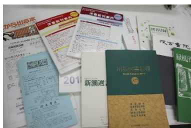
(選書用カタログ類)

日本研究を推進する資料、日文研が備えるべき資料等がありましたら、ぜひご推薦をお願いします。また、所員の著作・研究成果を普及させ、後世に遺すための收藏も行っていますので、ぜひご寄贈をお願いします。 (内線 2062 ukeire@nichibun.ac.jp)