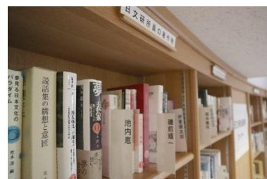
(所員著作コーナー)