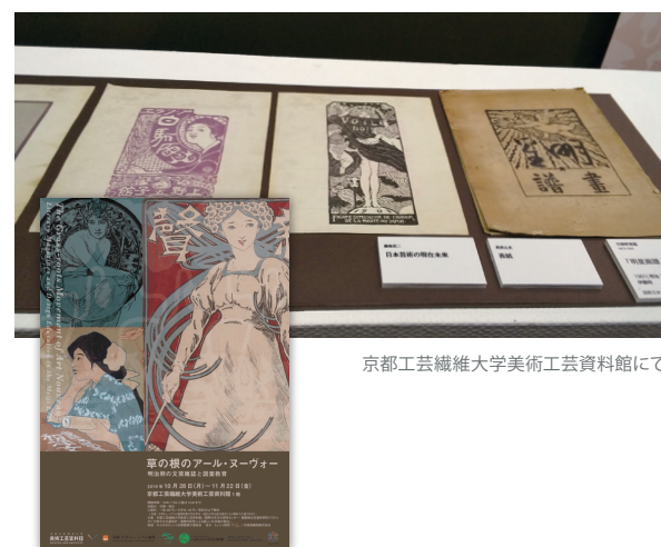
京都工芸繊維大学美術工芸資料館にて