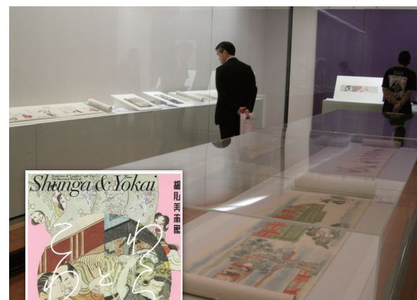
細見美術館での展覧会風景