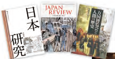
最近の日文研出版物