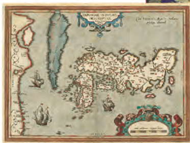
オルテリウス 「日本諸島図」

日本研究に必要な各種資料を幅広く収集し(図書資料約51万冊)、国内外の研究者の利用に供するとともに、様々な情報を提供しています。利用者は図書を自由に手にとって閲覧することができます。外部の方でも、学術研究・調査等を目的とする場合であれば、事前申請のうえ閲覧が可能です。