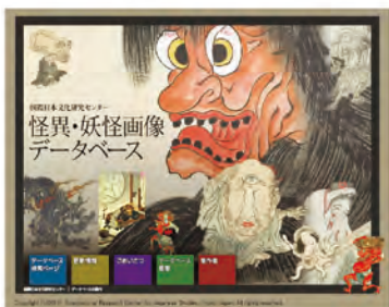
データベースの一例

日文研は、所蔵する日本研究資料、所員の研究成果をはじめ、他機関所有の日本研究資料などのデータベースを作成しており、現在49種類をウェブで公開しています。