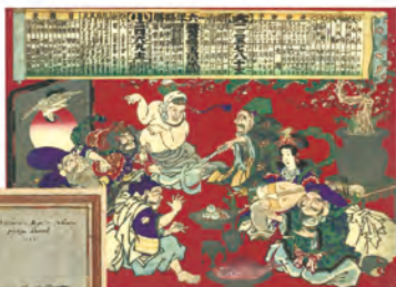
七福神：明治十六年略暦