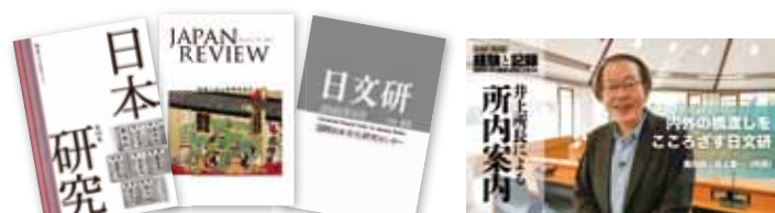
最近の日文研出版物