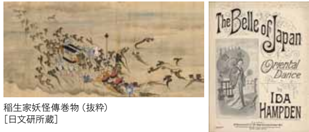
稲生家妖怪傳巻物（抜粋） 〔日文研所蔵〕

日本研究に必要な各種資料を幅広く収集し（図書資料約58万冊）、国内外の研究者の利用に供するとともに、様々な情報を提供しています。利用者は図書を自由に手にとって閲覧することができます。外部の方でも、学術研究・調査等を目的とする場合であれば、事前申請のうえ閲覧が可能です。